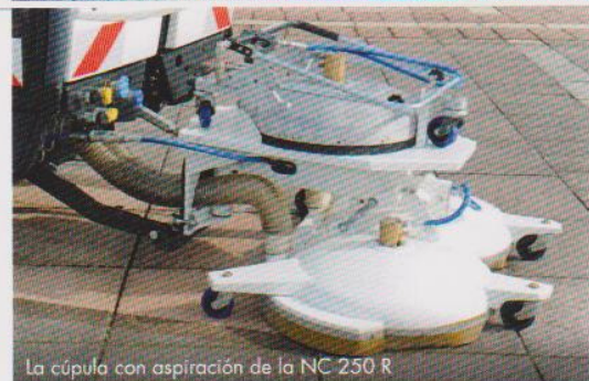
La cúpula con aspiración de la NC 250 R