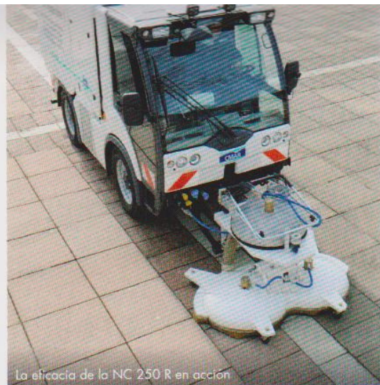
La eficacia de la NC 250 R en acción

Está equipada con las últimas tecnologías y del "know-how" de CMAR que ofrecen rendimientos ecológicos ( ahorro de agua ) y económicos ( bajo consumo de combustible ) excepcionales.