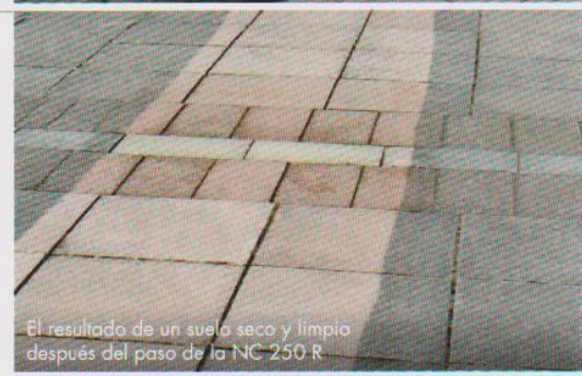
El resultado de un suelo seco y limpio después del paso de la NC 250 R